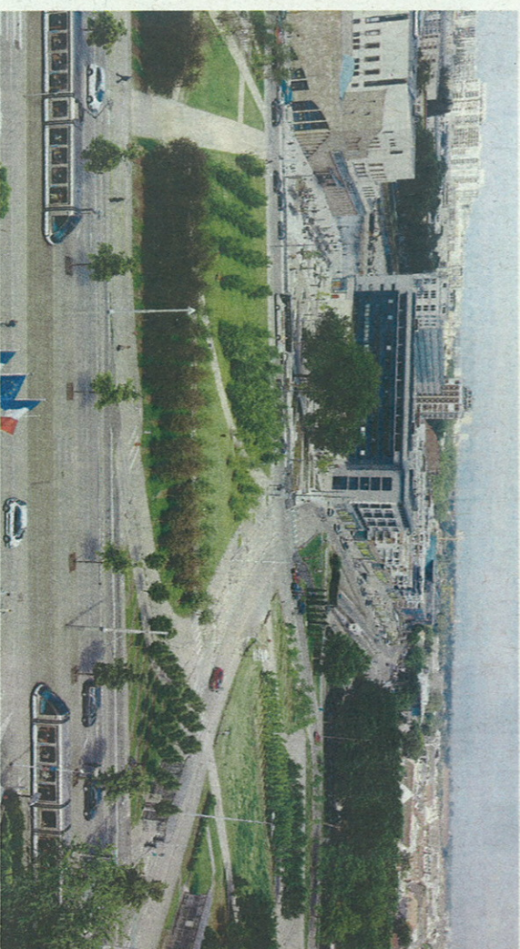
La première opération à réaliser sur la place de l'Étoile : la suppression du barreau central cet été.

L'Atelier de projet a encore du grain à moudre.